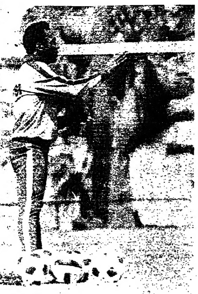
جميع كراته ووقف بينها تمهيدا للتسديد على الرمي